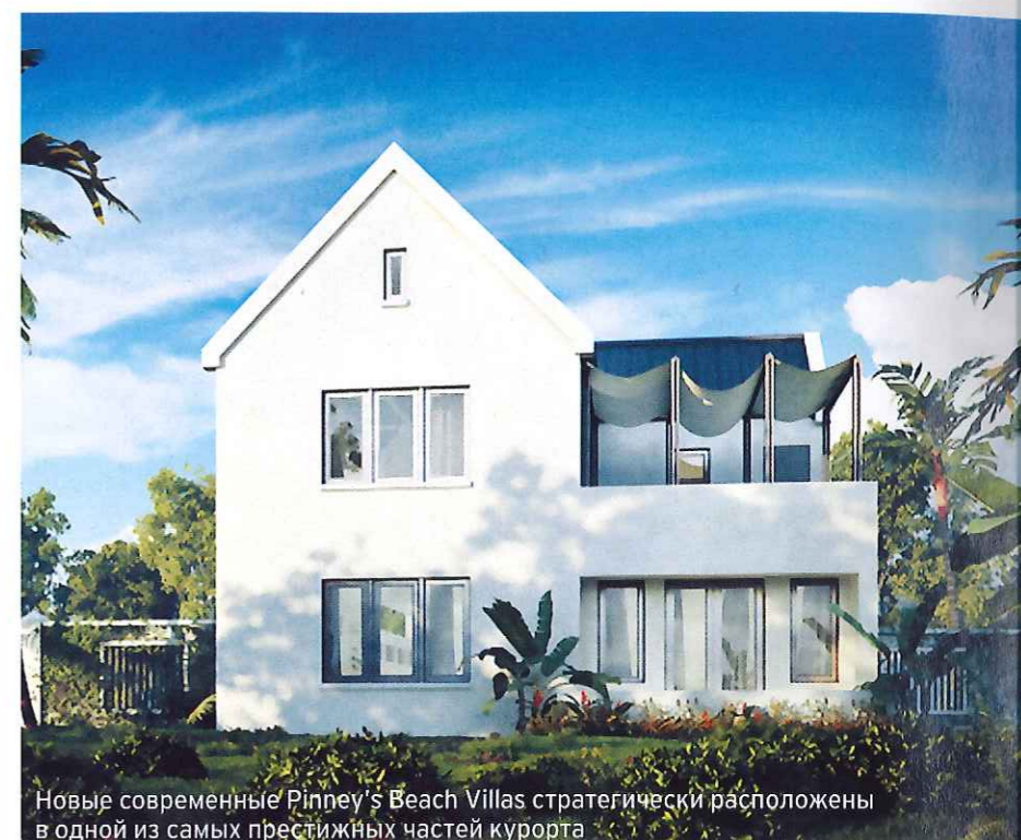
Новые современные Pinney's Beach Villas стратегически расположены в одной из самых престижных частей курорта

Комплекс располагает несколькими бассейнами, три из которых находятся в шаговой доступности от пляжа. Для любителей игры в гольф предлагаются поля на 18 и 9 лунок, с них открывается великолепный вид на соседний остров Сент-Китс. Игроки могут выбрать индивидуальные тренировки и получить профессиональные советы по подбору экипировки. Международный теннисный комплекс Peter Burwash, состоящий из 10 всепогодных кортов с профессиональным покрытием, включает также три освещенных корта для игры в темное время суток. Фитнес-центр оборудован самыми современными тренажерами для