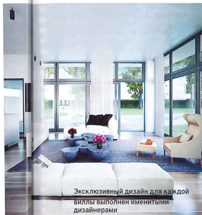
Эксклюзивный дизайн для каждой виллы выполнен именитыми дизайнерами

и несколько люксов самого высокого класса. Приобретение недвижимости для отдыха на территории комплекса дает владельцу и гостям пользоваться налаженной и усто-