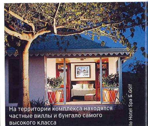
На территории комплекса находятся частные виллы и бунгало самого высокого класса

Пятизвездочный комплекс Four Seasons Resort Nevis, расположенный среди зеленых пальм острова Невис, отличается непревзойденным уровнем сервиса и безупречным вниманием к деталям. На территории комплекса находятся частные виллы и бунгало, а сам отель предлагает 196 номеров